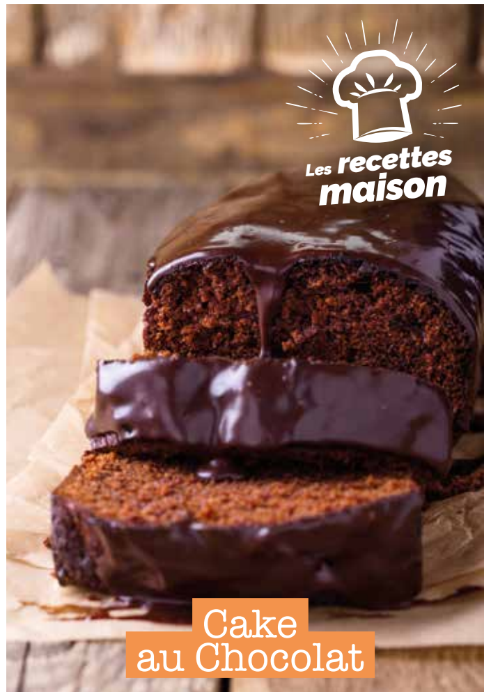
Cake au Chocolat