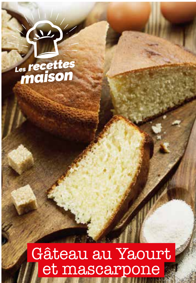
Gâteau au Yaourt et mascarpone