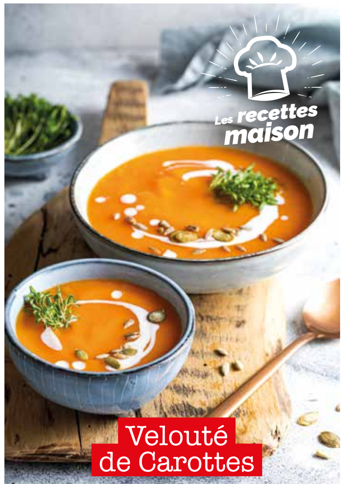
Velouté de Carottes