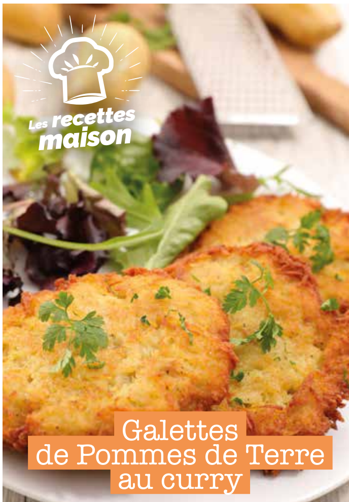
Galettes de Pommes de Terre au curry